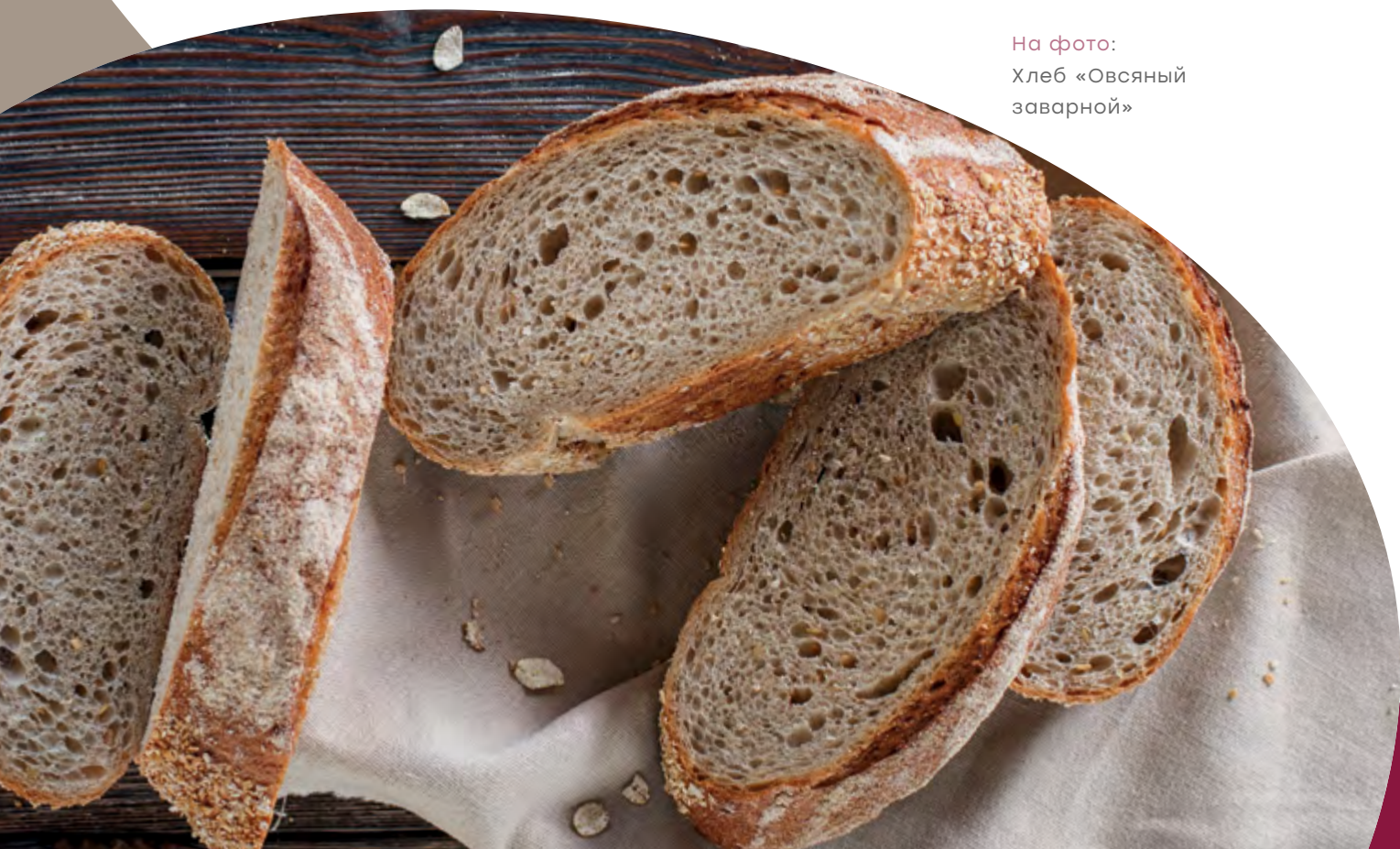
На фото: Хлеб «Овсяный заварной»